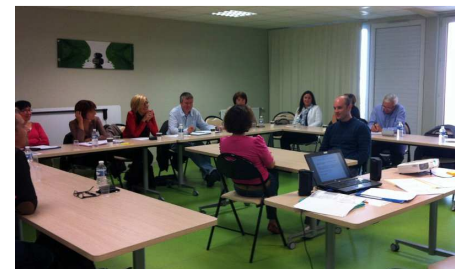
Sensibilisation à la diversité des managers de la CNIEG

FACE Loire Atlantique anime le Réseau Egalité Diversité en Pays de la Loire. Soutenu par la Région et la Direccte, ce réseau consiste à mettre en place des actions collectives visant à promouvoir la diversité et à lutter contre les discriminations dans les entreprises et les organisations. Chaque entreprise sensibilisée rejoint le Réseau Egalité Diversité.