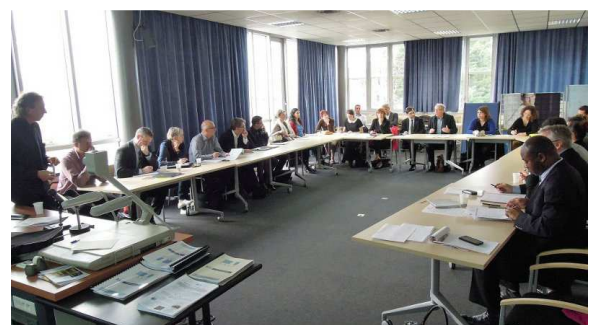
Présentation du contrat de génération par la Direccte