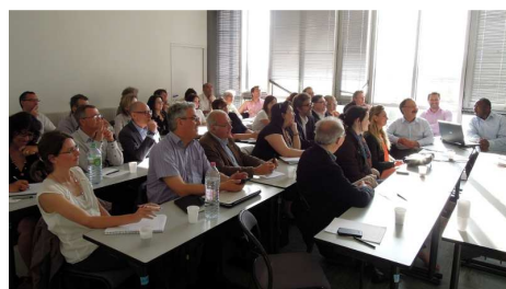
Manager la diversité pour en faire un levier de performances avec le cabinet H3O

Ces rencontres thématiques ont réuni en moyenne à chaque fois, une trentaine de participants.