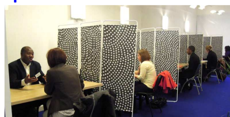
Place à l'emploi à Atlantis