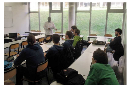
Sensibilisation à la diversité des élèves ingénieurs de Centrale

Ce réseau social devrait permettre aux chercheurs d'emploi accompagnés par FACE, de faire du lien entre eux (réseau, contacts, enquêtes métiers). Et aux professionnels d'entreprises d'échanger sur leurs bonnes pratiques RSE (parrainage, tutorat etc.).