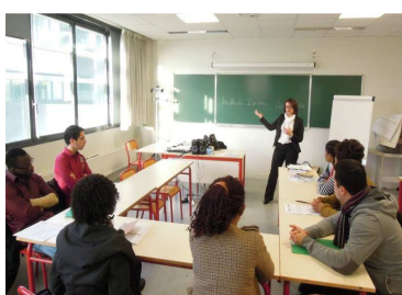
Intervention de Veolia à l'Ifocotep